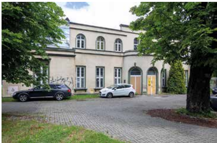
Budynek Pawilonu Sportowego przy kortach