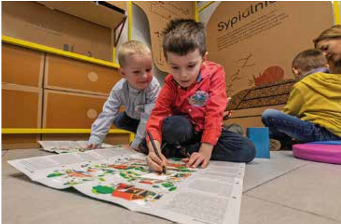
Przedszkolaki w Punkcie 11