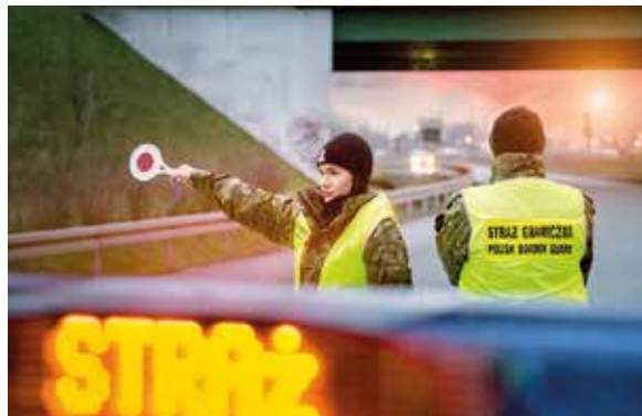
fol. FB Straży Granicznej