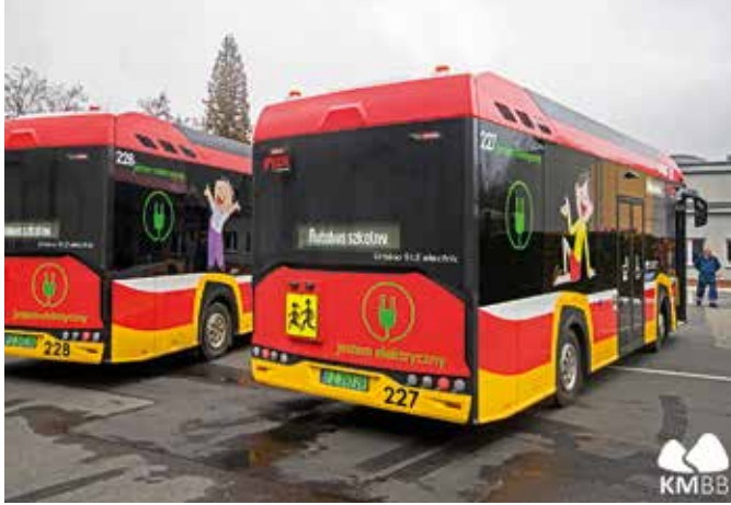
fol. Komunikacja Miejska w Bielsku-Białej

Mimo tego, że ostatnia seria przygód znanych bohaterów bielskich kreskówek: Bolka i Lolka została zrealizowana w 1986 roku – to nie koniec ich perypetii. Jeszcze w marcu ujawnią się bowiem z nową misją – jako patroni pierwszych autobusów elektrycznych w Bielsku-Białej, które zasilili tabor Miejskiego Zakładu Komunikacyjnego.